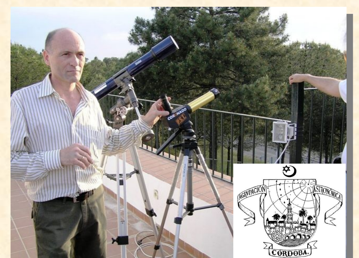
Observatorio de Cardeña