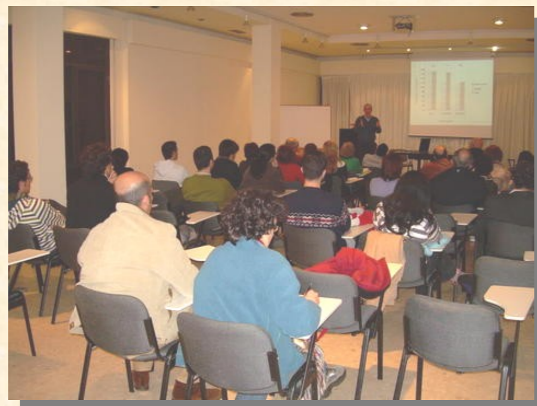
Genes y Ambiente