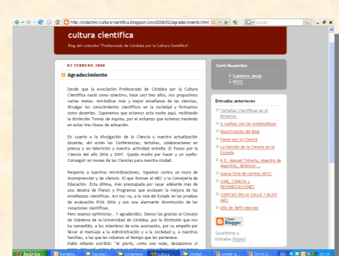
Blog “Cultura Científica”