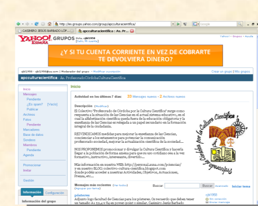
Lista de correos