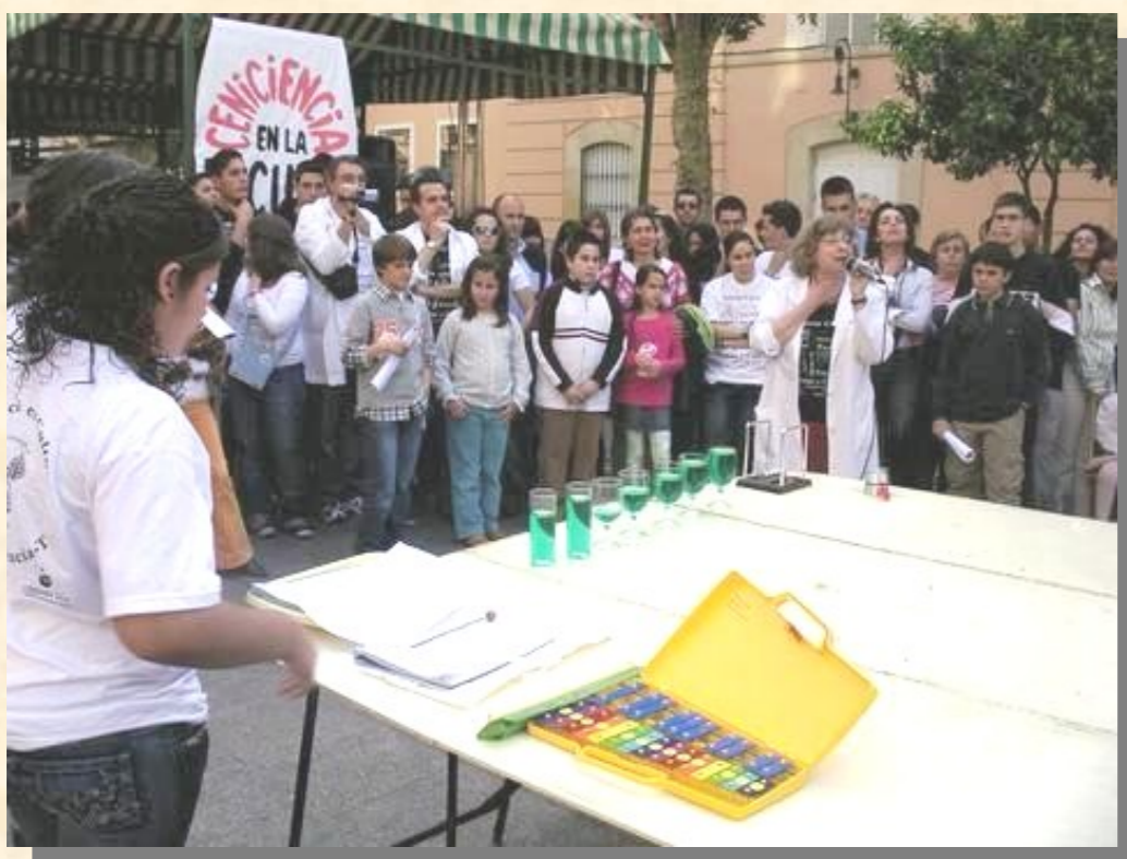
Física y Música