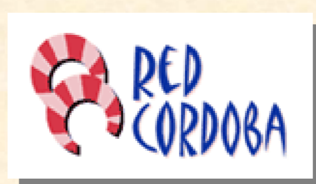
Foro “Salvar las Ciencias: SOS”