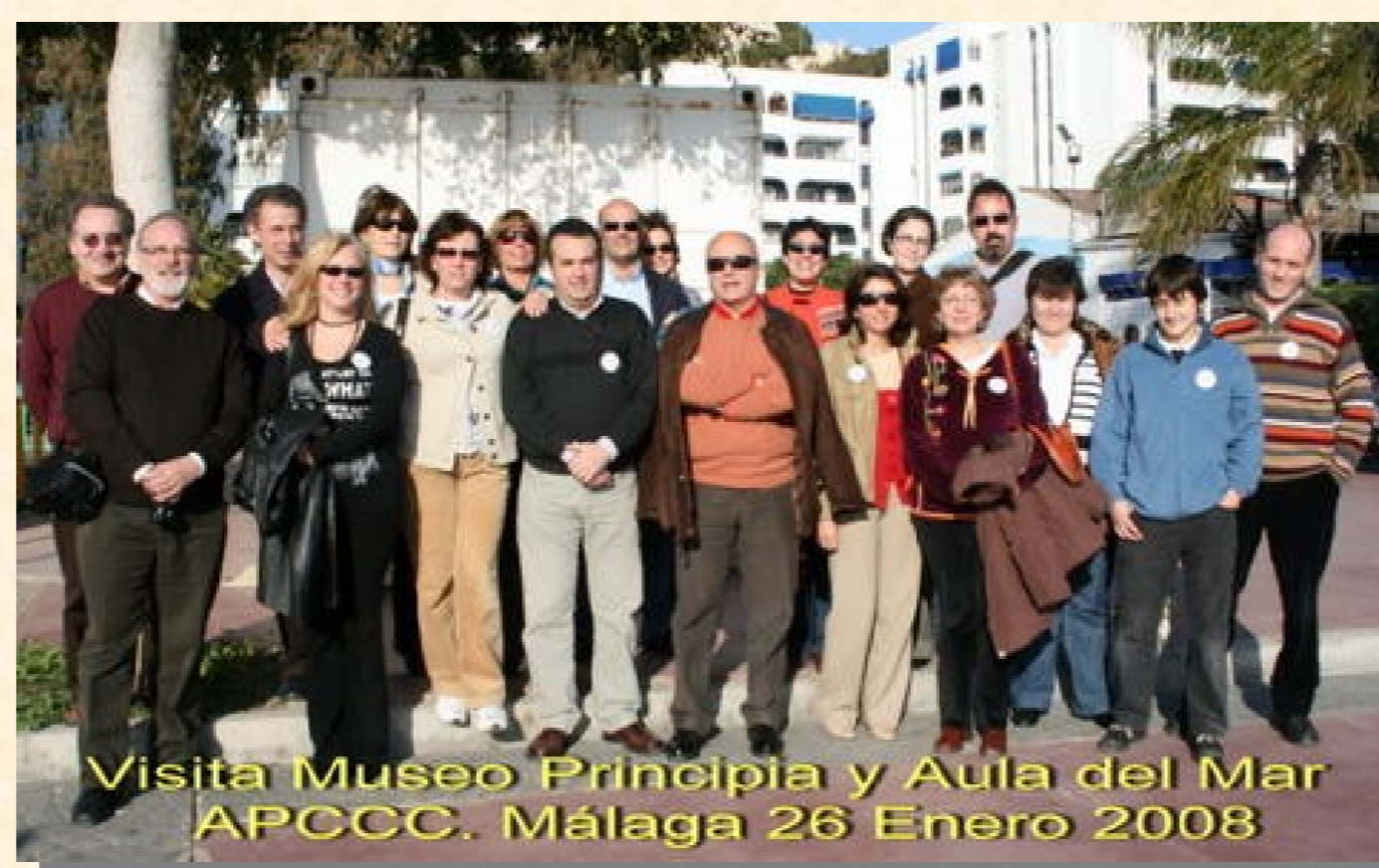
Museo Principia de Málaga